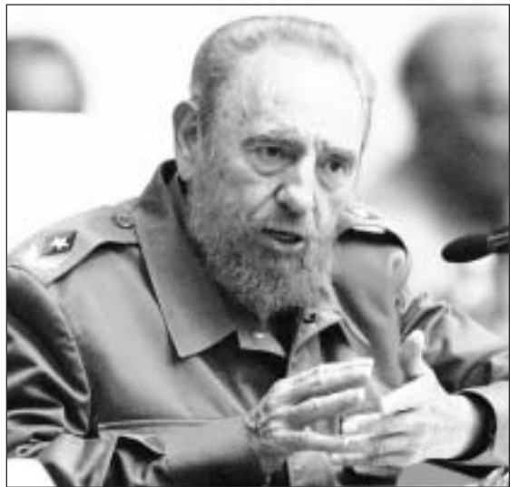
Fidel Castro convocó a los cubanos a marchar hoy para reclamar a EU el arresto de Posada Carriles.

El libro incluye un par de discos compactos, que fueron grabados por el mismo Reynaga y por otros cuatro hablantes nativos de inglés, y es distribuido por Barnes and Noble.